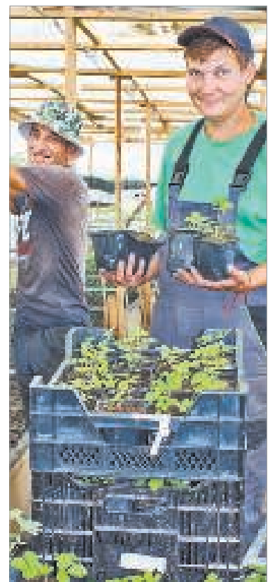
Работники питомника к своей работе всегда относятся с душой.

Много лет я живу и работаю в городе Пикалёво, и всегда приятно слышать слова благодарности от наших садоводов – огородников, которых мы обеспечиваем саженцами и рассадой. В нашем