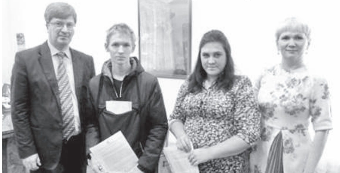
На вручении ключей от квартир детям-сиротам