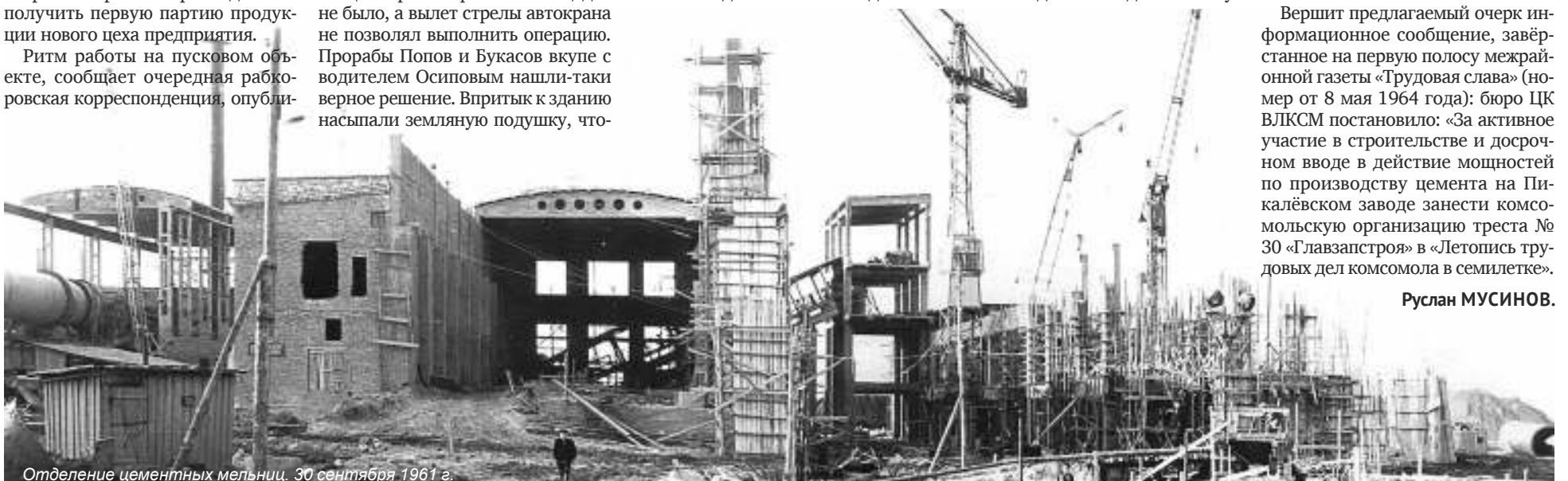
Отделение цементных мельниц. 30 сентября 1961 г.