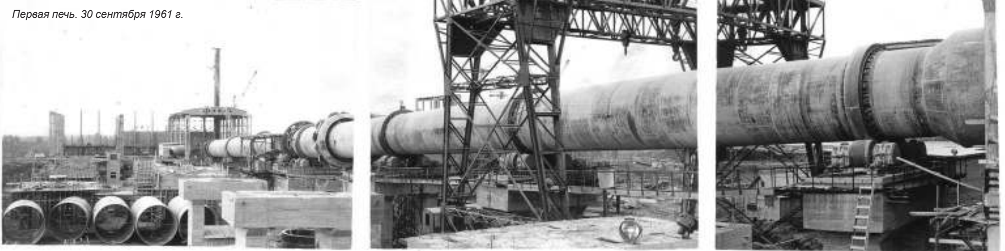
Первая печь. 30 сентября 1961 г.

Всё чаще под рубрикой «На строительстве Пикалёвского цемзавода» на страницах районной газеты появляются толковые, взвешенные выступления рабкора Л. Букасова. Опытный прораб, он на всё смотрит цепким, профессиональным глазом, верно оценивает подоплёку проблем, которые тормозят ударную стройку.