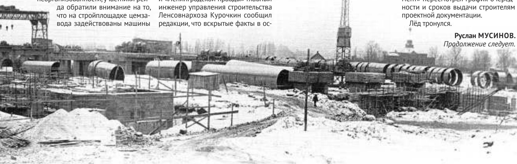
Стройплощадка цементного отделения. 30 декабря 1960 г.