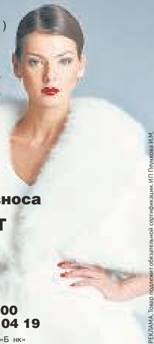
РЕКЛАМА. Товар подлежит обязательной сертификации. ИП Печникова И.М.

Ген. лицензия ЦБ РФ №2766 от 04.03.2008 г. ОАО ОТП «Б НК»