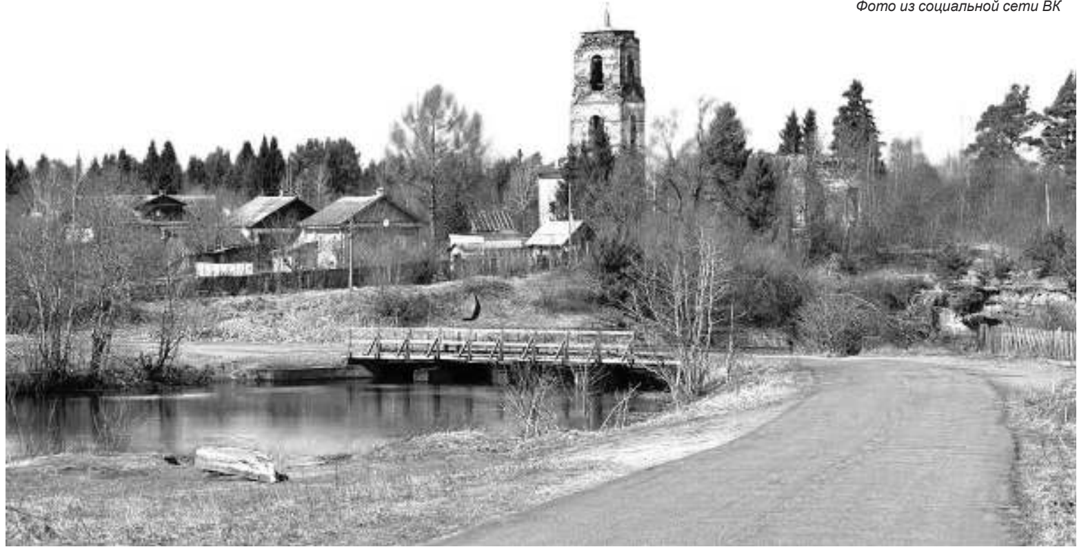
Михайловский Озерской погост. Современное состояние

В сохранившейся части писцовой книги 1563 года описание церковного прихода Озерского погоста отсутствует. В писцовой книге 1583 года писца Андрея Плещеева было отмечено: А на по-