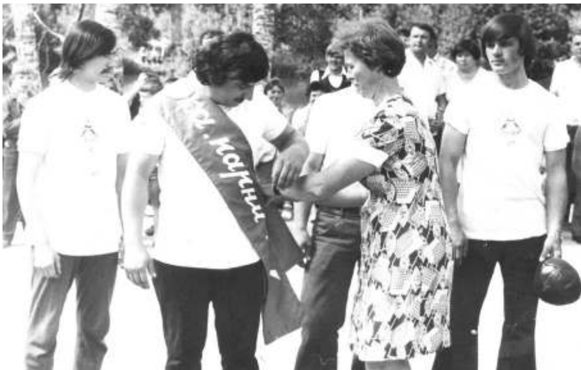
Конкурс «А ну-ка, парни»