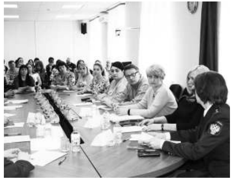
На семинаре по защите прав потребителей