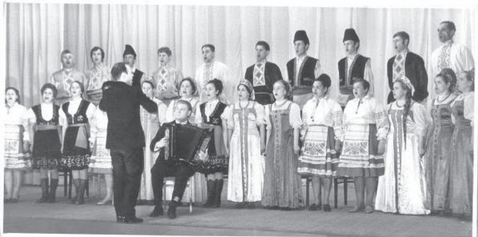
Хор цементного завода, 1959 г.