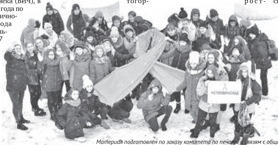
Материал подготовлен по заказу комитета по печати и связям с общественностью Ленинградской области.