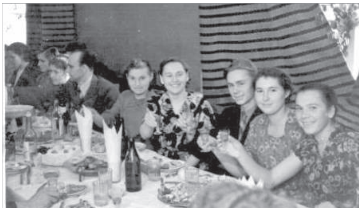
Комсомольско-молодёжная свадьба, 13 июня 1958 г.