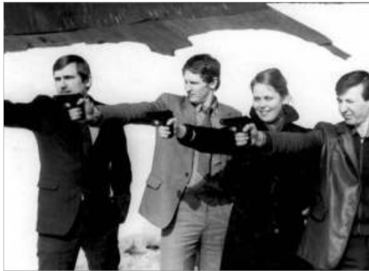
В подшефной воинской части, контрольная пристрелка