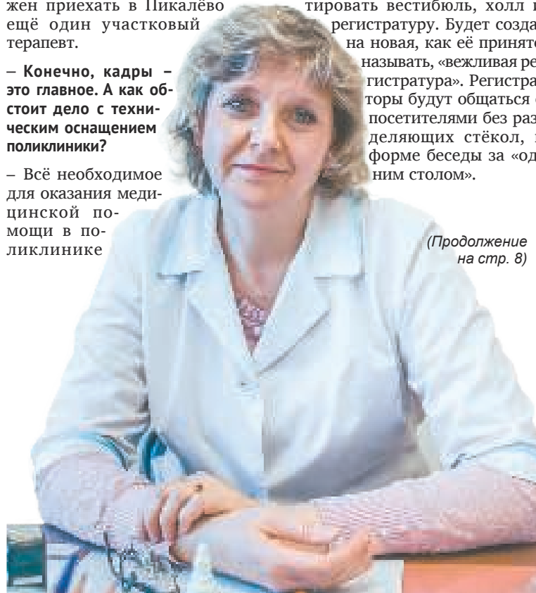
(Продолжение на стр. 8)

В частности, до конца года в поликлинике планируется отремонтировать вестибюль, холл и регистратуру. Будет создана новая, как её принято называть, «вежливая регистратура». Регистраторы будут общаться с посетителями без разделяющих стёкол, в форме беседы за «одним столом».