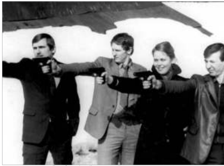
В подшефной воинской части, контрольная пристрелка