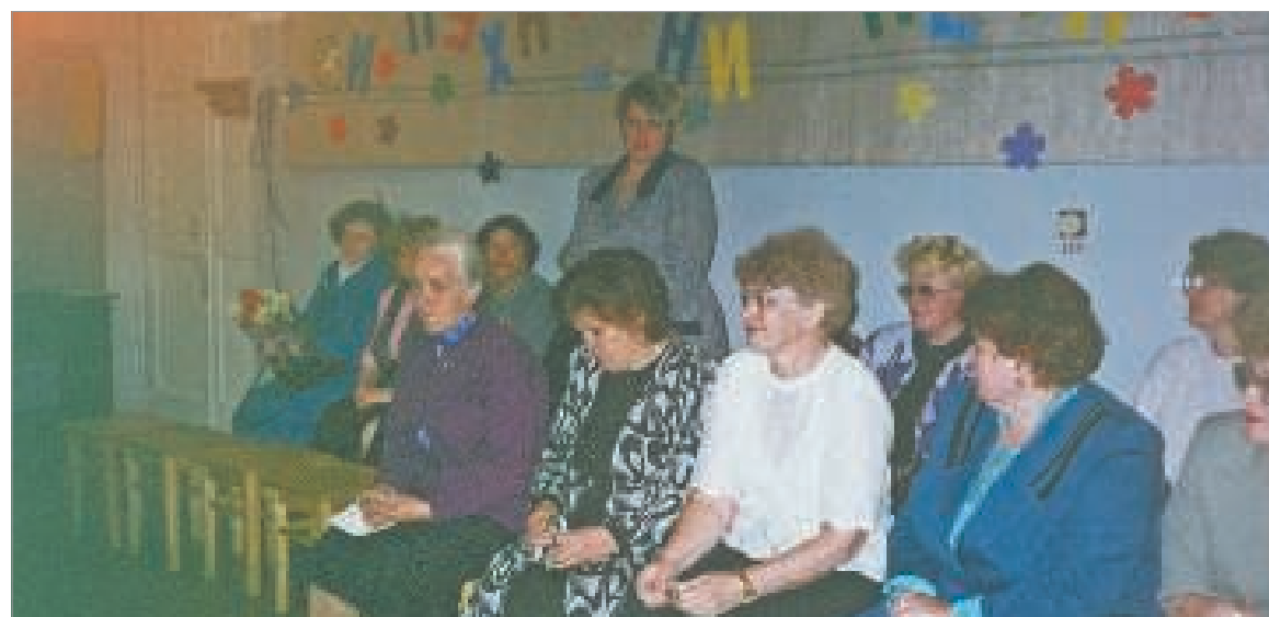
Выпускной вечер 1998 года, вручение аттестатов