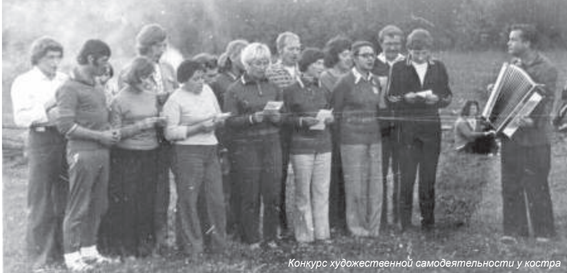
Конкурс художественной самодеятельности у костра

Продолжение. Начало в №38 от 27.09.2017 г.