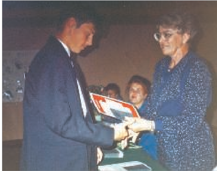
Торжественное вручение аттестатов зрелости

Как быстро развивались события, и виною или счастьем тому была молодость.