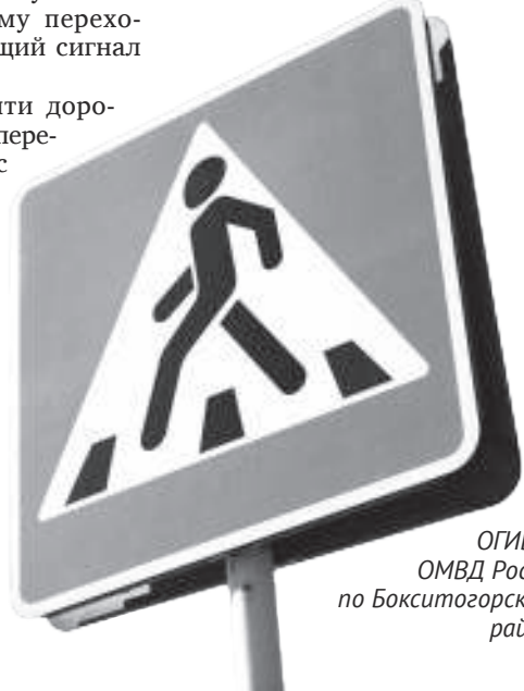
ОГИБДД ОМВД России по Бокситогорскому району

Будьте внимательны и снижайте скорость при проезде участка дороги, где возможно появление пешеходов, берегите свою и чужую жизнь! Помните, что соблюдение Правил дорожного движения – это залог вашей безопасности на дороге!