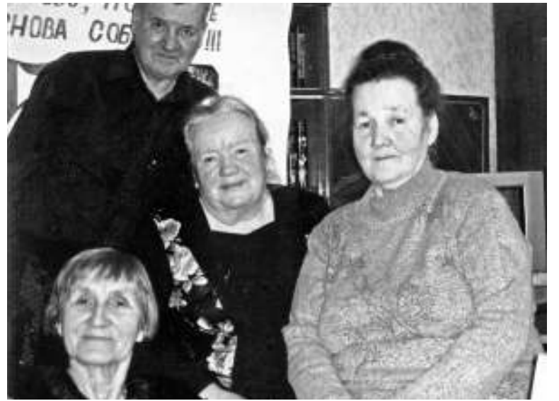
На встрече с одноклассниками в Тихвине, 2004 г.