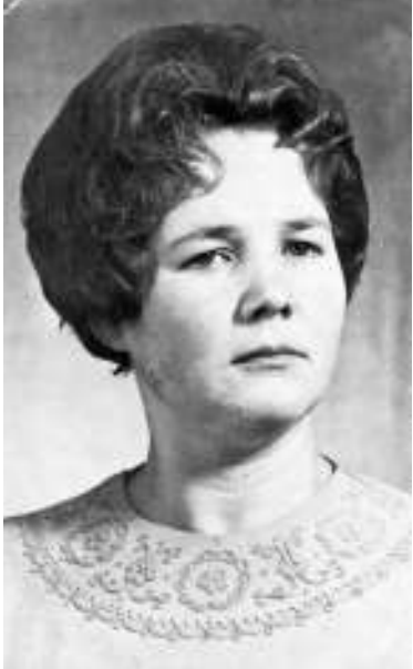
Вступление в партию, 1975 г.

Четырнадцатого мая текущего года исполнилось 85 лет алюминиевой промышленности России. В этот день в 1932 году на Волховском заводе Ленинградской области был получен первый в России слиток алюминия. В годы первых пятилеток производству алюминия как стратегически важному конструкционному материалу для развития базовых отраслей экономики и укрепления обороны страны придавалось огромное значение!