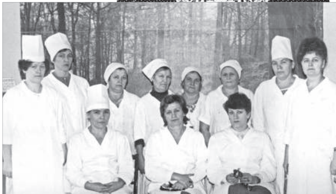
Коллектив терапевтического отделения больницы г. Пикалёво, 1986 год

Это были времена, когда не принято было думать о деньгах. Мы получали маленькие зарплаты, но были очень счастливы. Потому что с душой делали своё дело. Не жалели ни сил, ни времени на пациентов. И верили в то, что людей