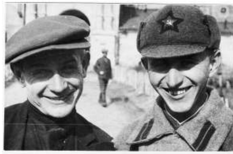
1936 год. Годовиков с отцом