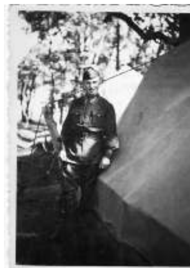
Август 1940 года