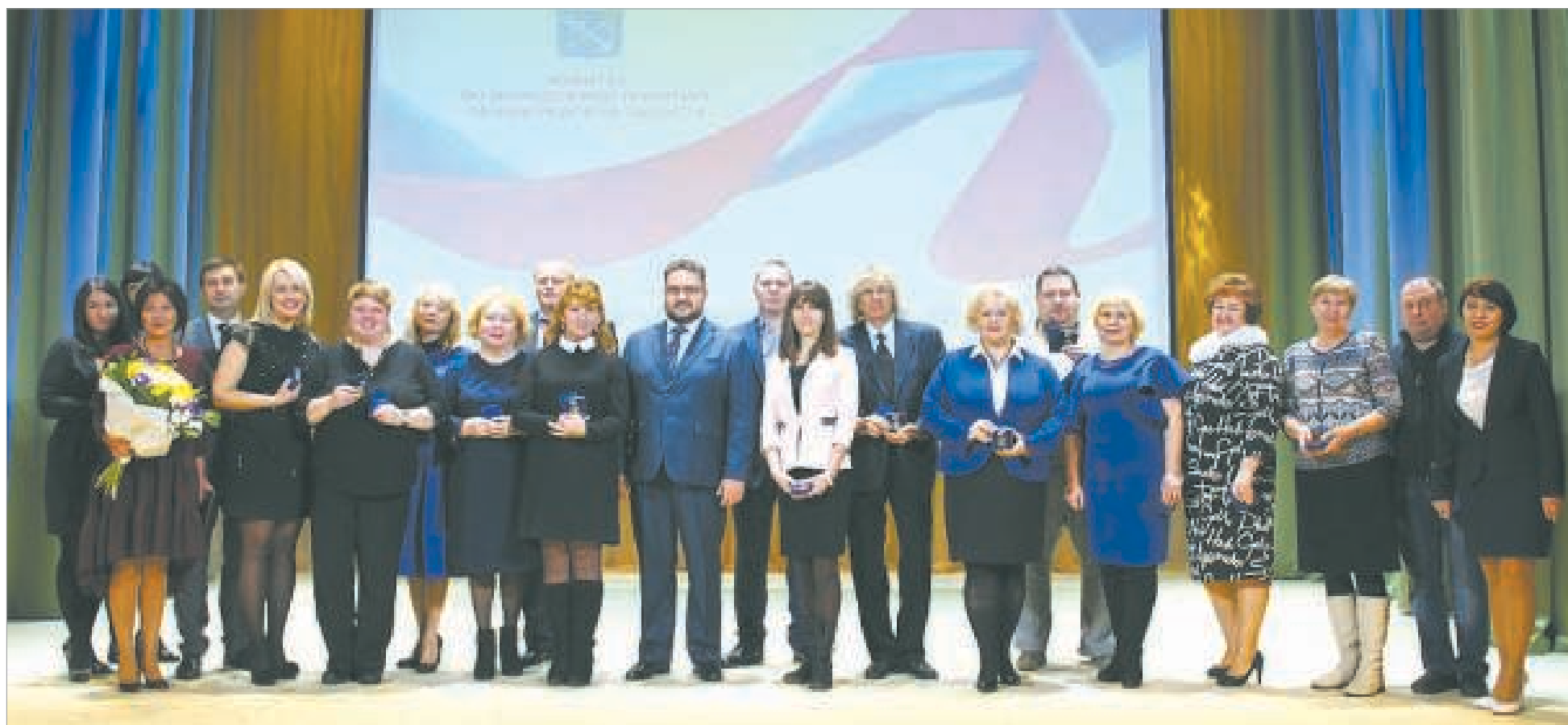
Представители Бокситогорского района на церемонии награждения победителей и призёров