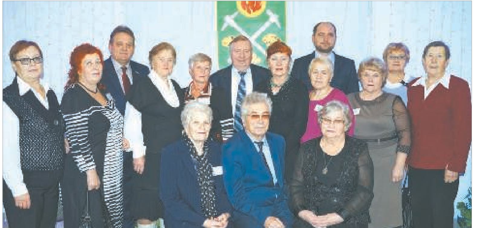
Делегация ветеранов г. Пикалёво

Негативные последствия для рынка парфюмерно-косметической продукции после запрета сухого алкоголя исключены, уверены в Роспотребнадзоре. Замечания Минэкономразвития к проекту закона о сухом алкоголе учтены. Существует риск распространения понятия «порошкообразная спиртосодержащая продукция» на парфюмерно-косметическую продукцию, такую как зубной порошок, румяна или сухие духи, в состав которой входит отдушка, представляющая собой спиртовой раствор душистых веществ и этиловый спирт. «Сухой алкоголь» – порошок инкапсулированного алкоголя, который при смешивании с водой образует алкогольный напиток.