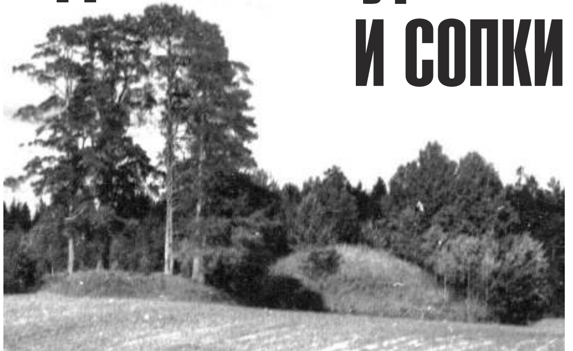
Озерёвские сопки на берегу реки Чагоды. Фото автора 1971 г.

территории, занимаемой в прошлом восточнославянскими племенами, но новгородские сопки заметно отличаются по форме и строению от других курганных насыпей. Форма сопки своеобразна, она – усечённо-коническая. Наверху сопки имеют определённую выраженную горизонтальную площадку и крутые бока. Есть сопки, которые расплылись, осели за тысячу лет, но первоначальная их форма – подчёркнутая крутобокость.