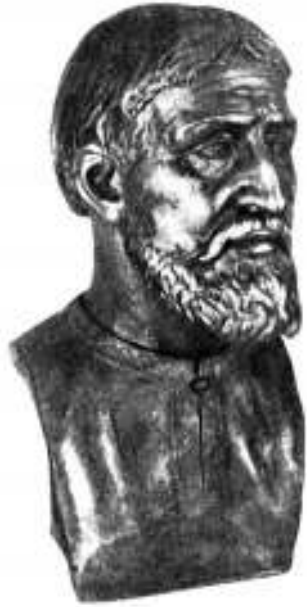
Кривич. Историческая реконструкция

Расположенные на территории Бокситогорского района археологические памятники в виде длинных курганов и сопки являются свидетелями заселения нашего края славянскими племенами. Длинные курганы соотносятся с племенами кривичей, а сопки, появившиеся несколько позднее, оставлены племенами ильменских или новгородских словен. Часть населения нашего края, несмотря на многочисленные переселения и миграции, является потомками данных славянских племён.