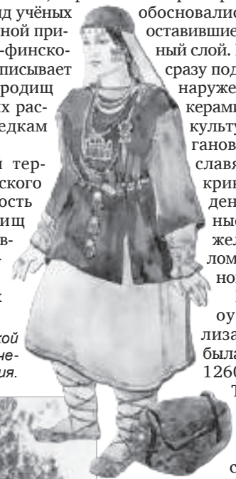
Женщина «дьяковской культуры». Историческая реконструкция.