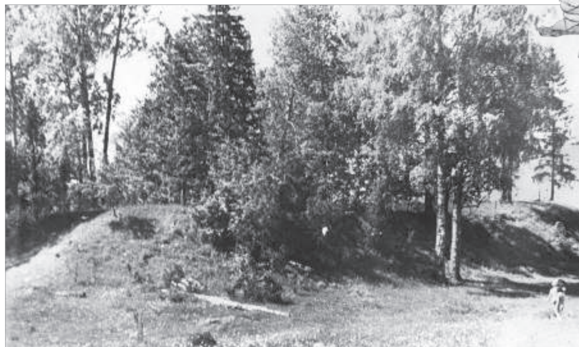
«Дьяковское городище» у деревни Городок на реке Чагоде. 1971 г.