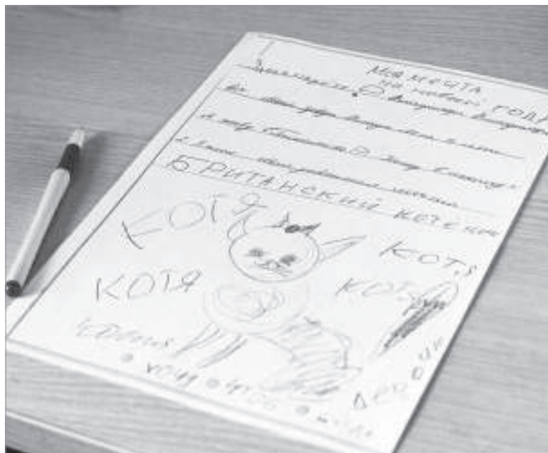
Письмо Влады Шарай к Владимиру Путину

После дороги котёнок был напуган, но в детских руках быстро успокоился. Пушистая шубка,