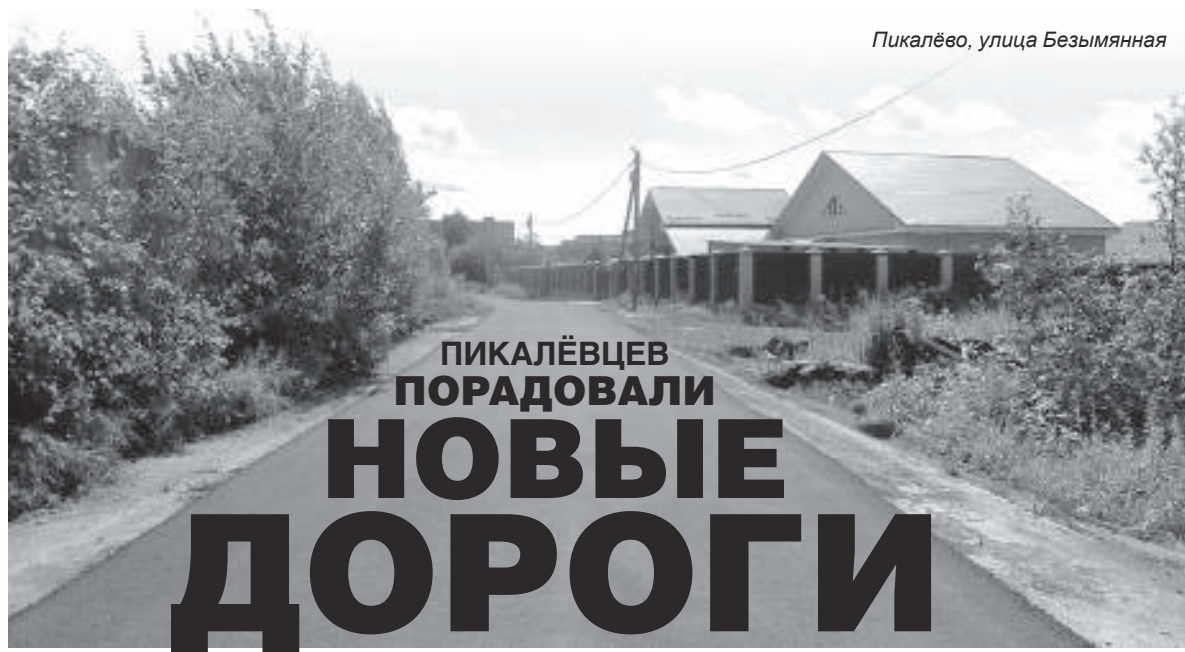
Пикалёво, улица Безымянная

МУ Физкультурно-оздоровительный комплекс.