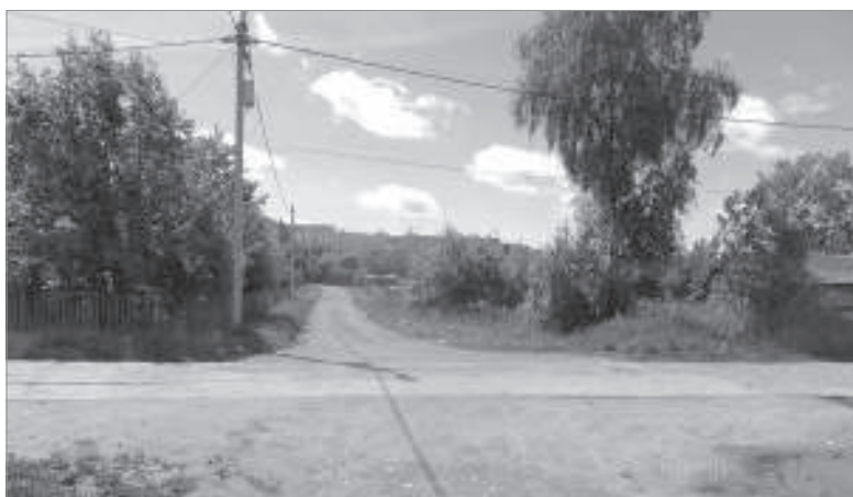
Пикалёво, 2-й Средний переулоч