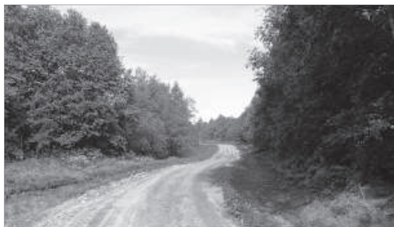
д.Новли, улица Центральная