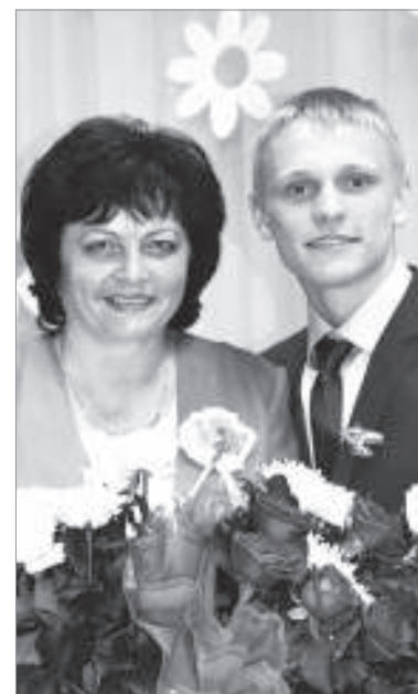
профессией и делаю всё зависящее от меня – хорошо учусь, занимаюсь спортом, готовлюсь к экзаменам, чтобы осуществить свою мечту

– Причин много. Защита Отечества – почётное право каждого гражданина. Миллионы советских солдат и офицеров отдали свои жизни, спасая мир от фашизма во время Великой Отечественной войны. И пока жива и передаётся из поколения в поколение память о той священной войне, пока мы чтим и восхищаемся своими героями, мы будем непобедимы и сильны. Армия учит быть не только сильным, но и верным – верным своей семье, своему народу, своей стране. Я хочу, чтобы мои родители, друзья, близкие и дорогие мне люди были уверены, что над их головами всегда будет мирное небо. Я определился с