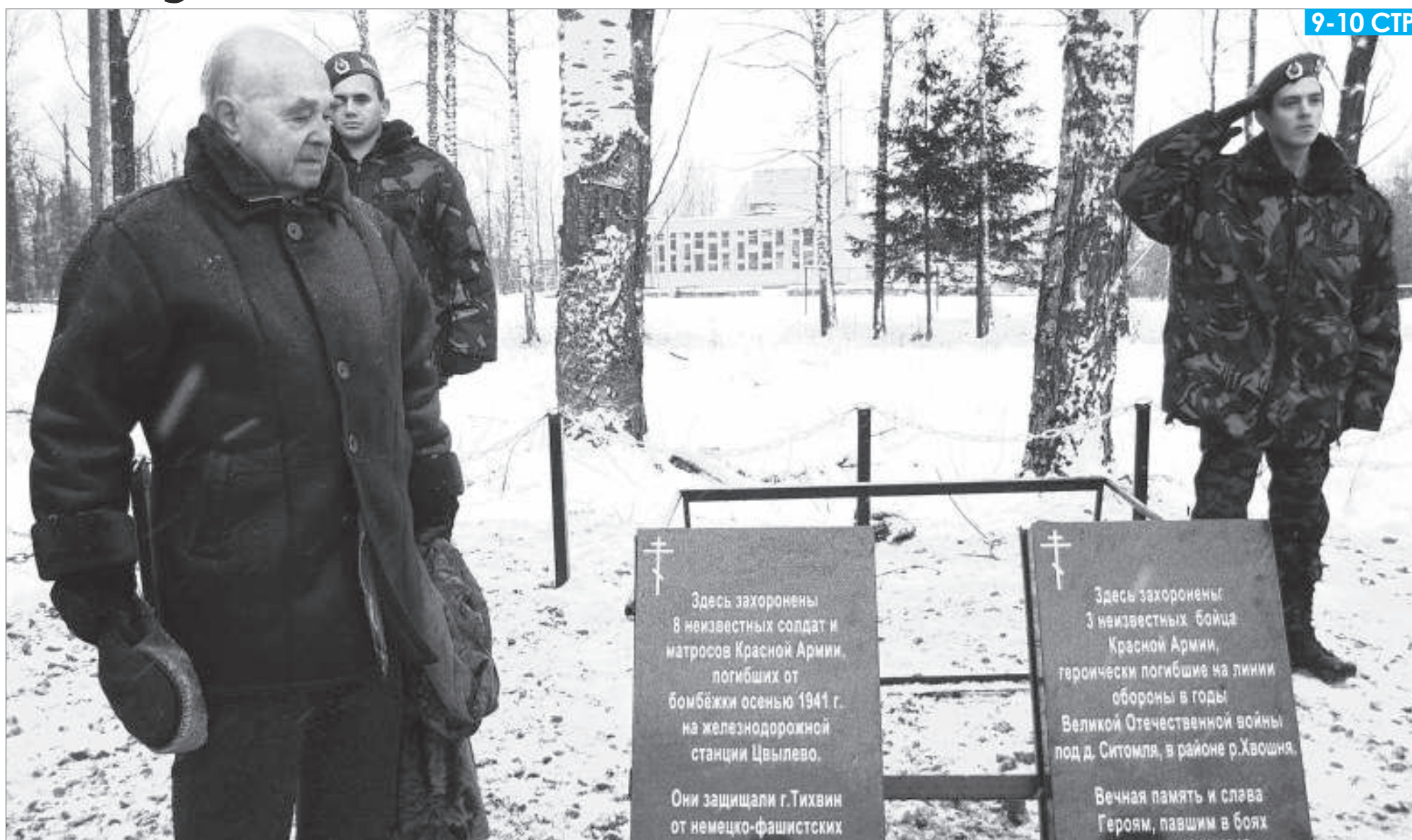
Город воинской славы Тихвин 9 декабря отмечал день освобождения от немецко-фашистских захватчиков. В этот день в посёлке Цвылёво Тихвинского района установлены мемориальные плиты в память о бойцах, погибших в годы войны