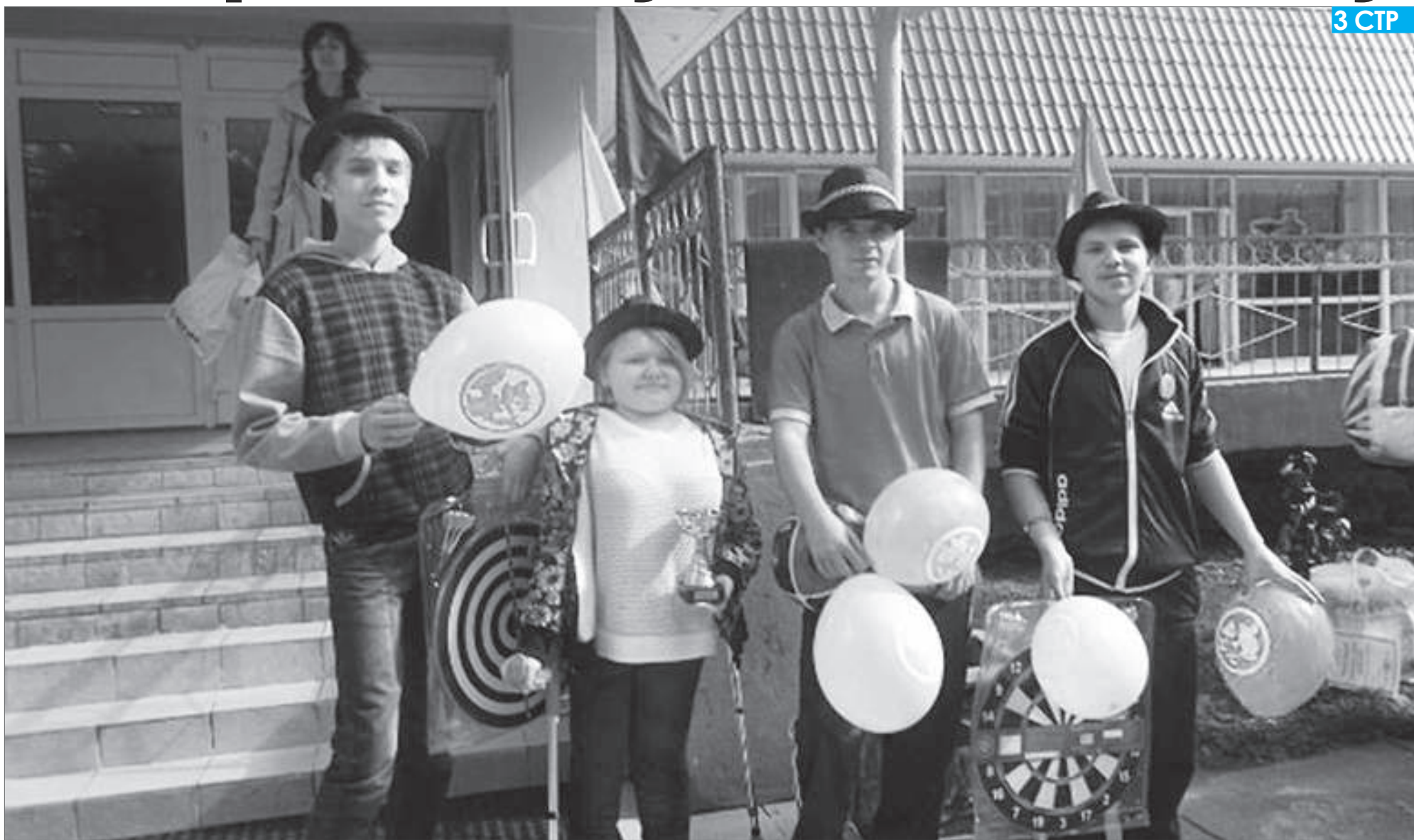
За участие в областной спортивной олимпиаде для детей-инвалидов команда города Пикалёво привезла в Бокситогорский район кубок участников олимпиады, а каждому юному спортсмену были вручены заслуженные призы.