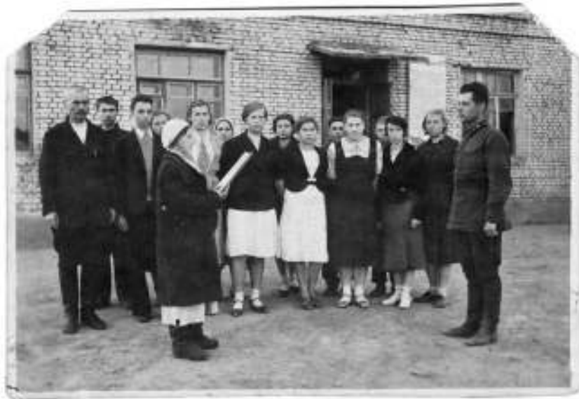
Принятие присяги. Авиамастерские №261. ВОВ

Перед нами редчайшая фотография от 3 августа 1942 года, пришедшая по почте в Зиновью Гору: