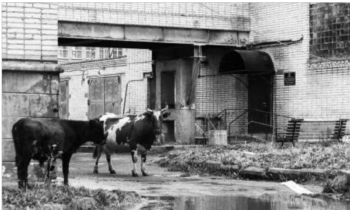
У соцзащиты, город Пикалёво